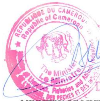
Docteur TAÏGA MINISTRY OF LIVESTOCK, FISHERIES AND ANIMAL INDUSTRIES