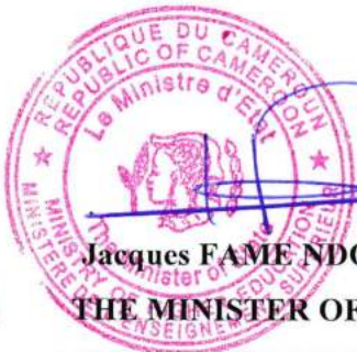
Jacques FAME NDONGO THE MINISTER OF STATE, MINISTER OF HIGHER EDUCATION

ARTICLE 12: The Director of Limbe Nautical Arts and Fisheries Institute (LINAFI) and the Director for University Accreditations and Quality (DAUQ) are each in his capacity, responsible for the implementation of this decision, which shall be registered, published and broadcasted wherever need be. /-