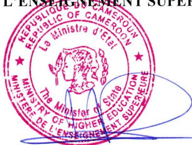
Pr. JACQUES FAME NDONGO

LE MINISTRE D'ÉTAT, MINISTRE DE L'ENSEIGNEMENT SUPÉRIEUR